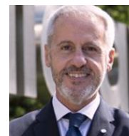
BANCO MEDIOLANUM FRANCESCO D' ITALIA DTOR. PLANIFICACIÓN COMERCIAL, SELECCIÓN Y FORMACIÓN